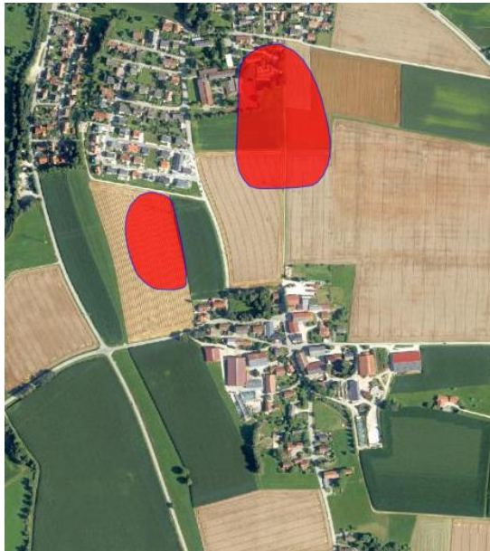
Abb. 4 Bau- und Bodendenkmäler, ohne Maßstab, Quelle: Bayerische Vermessungsverwaltung, Bayerischer Denkmal-Atlas, Stand 09/2022

Entsprechend dem Bayerischen Denkmalatlas sind nördlich von Breitötting zwei Bodendenkmäler vorhanden (D-1-7737-0369, Siedlung der mittleren und späten Latènezeit, D-1-7737-057 Siedlung der späten Latènezeit). Das als Baudenkmal geschützte Gasthaus gibt es nicht mehr.