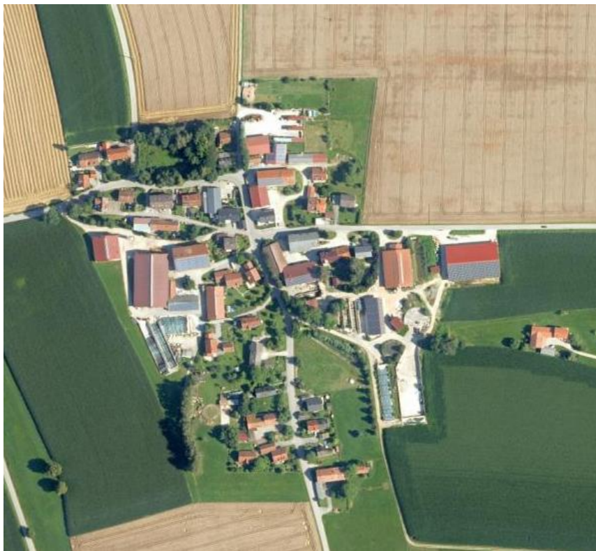
Abb. 3 Luftbild, ohne Maßstab, Quelle: Bayerische Vermessungsverwaltung Eurographics, Bayerischer Denkmal-Atlas, Stand 09/2022

Der Geltungsbereich der Änderung hat eine Fläche von rund 7,1 ha.