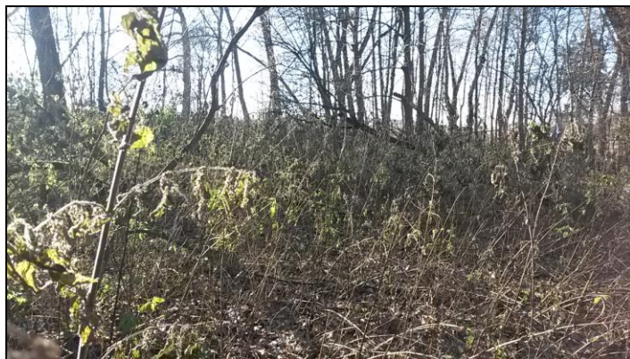
Laubgehölze mit Brennnesselaufwuchs im Süd-Osten

Das L-förmige Gewässer im Süd-Osten wird durch Schilfrohr geprägt. Vereinzelter Erlenaufwuchs ist vorhanden, jedoch ist das Gewässer hauptsächlich von Fichten umgeben.