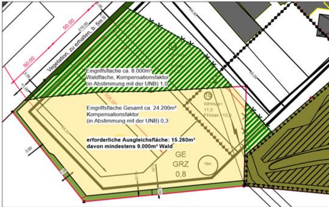
Ermittlung Eingriff- / Ausgleichsflächen