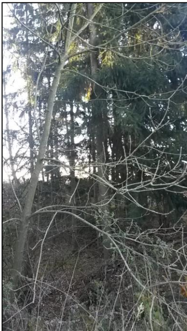
Nadelgehölze im Süd-Osten

Pionierarten sind durch die verschlechterten Lebensbedingungen kaum mehr vorhanden.