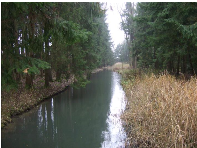
Gewässer / Biotop im Süd-Osten

Das L-förmige Gewässer im Süd-Osten wird durch Schilfrohr geprägt. Vereinzelter Erlenaufwuchs ist vorhanden, jedoch ist das Gewässer hauptsächlich von Fichten umgeben.